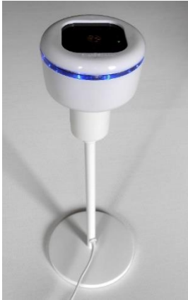
Support de lampe