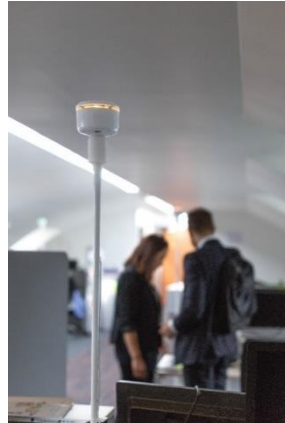
Support de pince de bureau