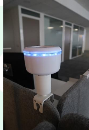
Support de pince d'écran